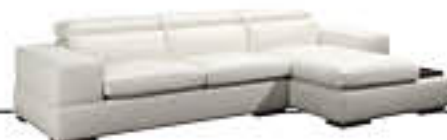
SENSATION immagini p. 14