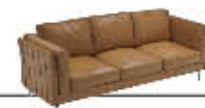
EVITA immagini p. 14