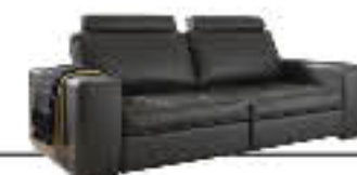
PANTHER immagini p. 14