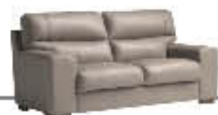
CANNES immagini p. 14