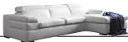
MIRO' immagini p. 14