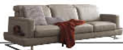
PEGASO immagini p. 14