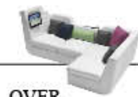
OVER immagini p. 14