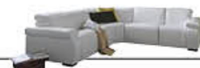
HYDING immagini p. 14