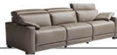
ERIDANO immagini p. 14