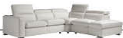
VERTIGO immagini p. 14