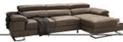
INVICTUS immagini p. 14