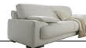
EVITA immagini p. 14