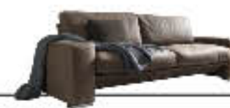
JAVA immagini p. 14