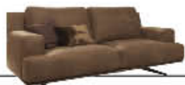
FOSTER immagini p. 14