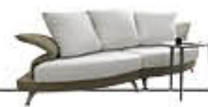
ALIBI immagini p. 14