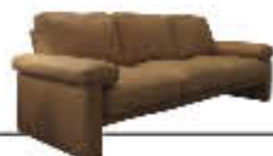
ARISTO immagini p. 14