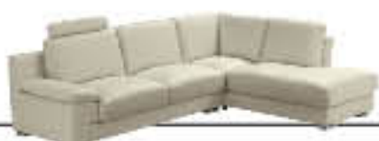
HUGO immagini p. 14