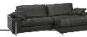
ALTEREGO immagini p. 14