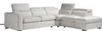
GRETA immagini p. 14