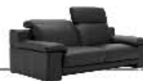
EVERGREEN immagini p. 14